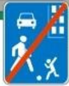
Знак "Конец жилой зоны"