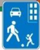
Знак "Жилая зона"

ПРАВИЛО 3: Не играй на проезжей части дороги даже во дворе собственного дома.