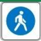
Знак "Пешеходная зона"