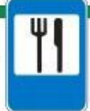
Знак "Пункт питания"